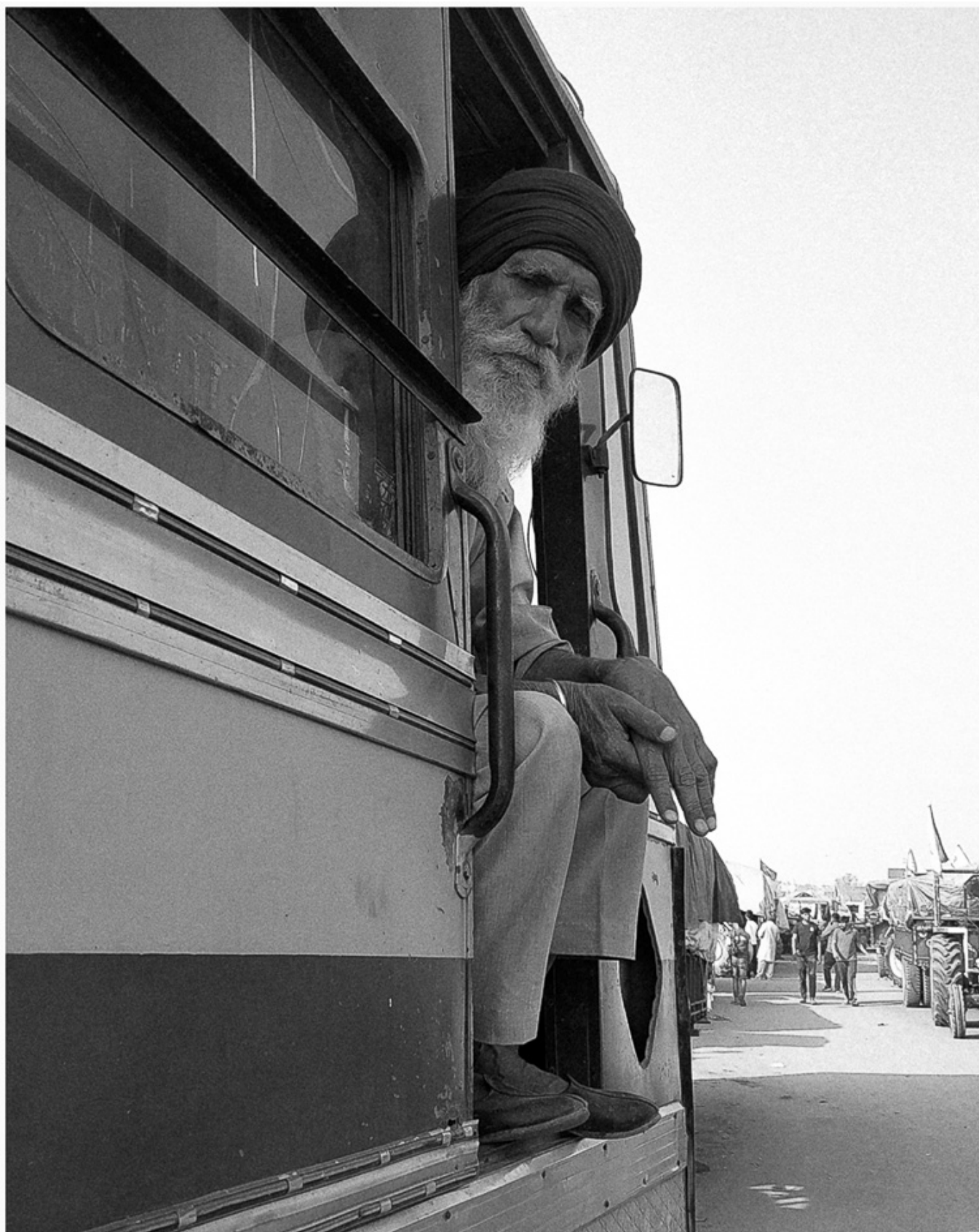
2020年12月5日，德里和辛古的交界处，卡车中的抗议农民。维卡斯·塔库尔（三大洲社会研究所）