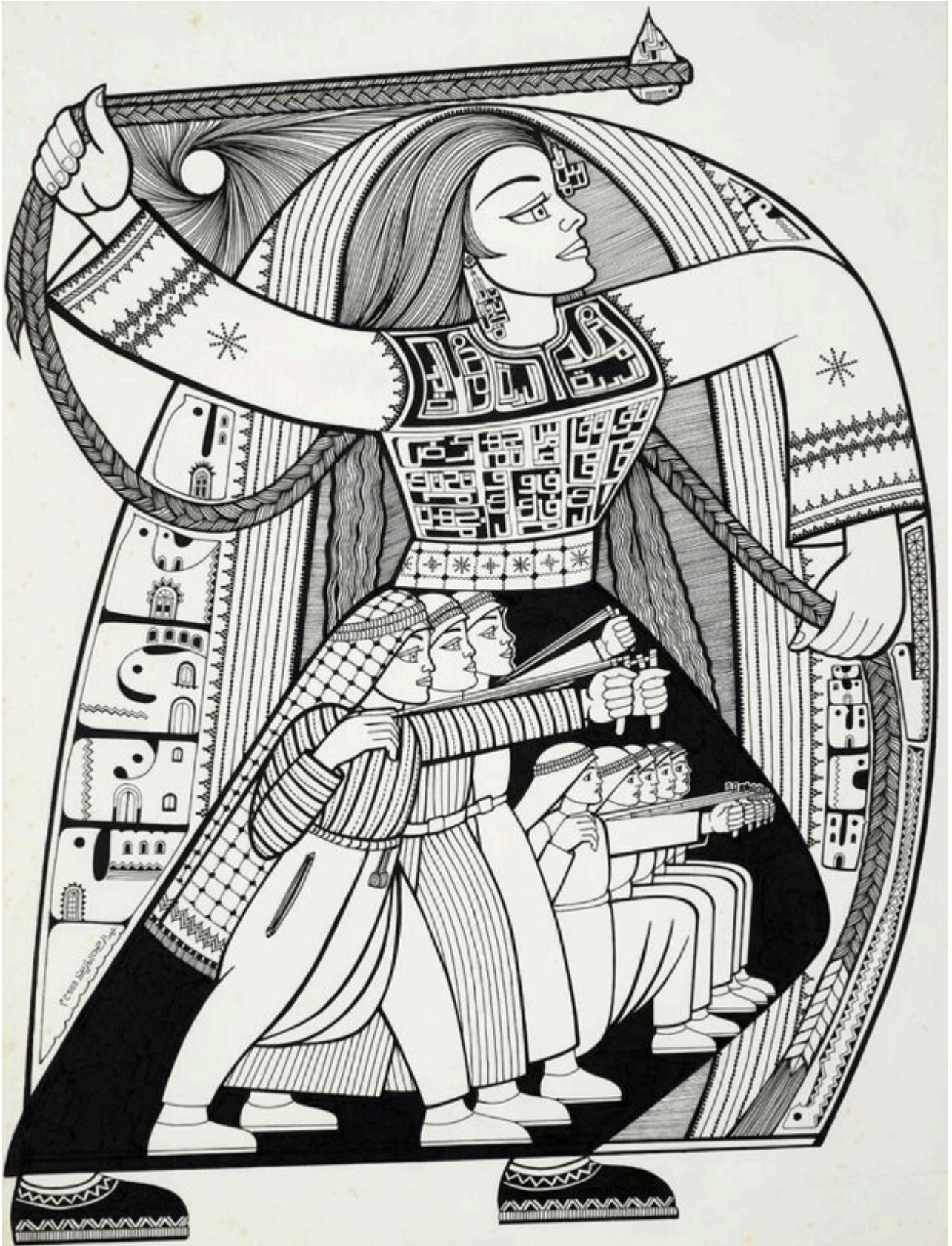
《杰宁》阿卜杜勒·拉赫曼·莫扎伊恩（巴勒斯坦）作于2002年