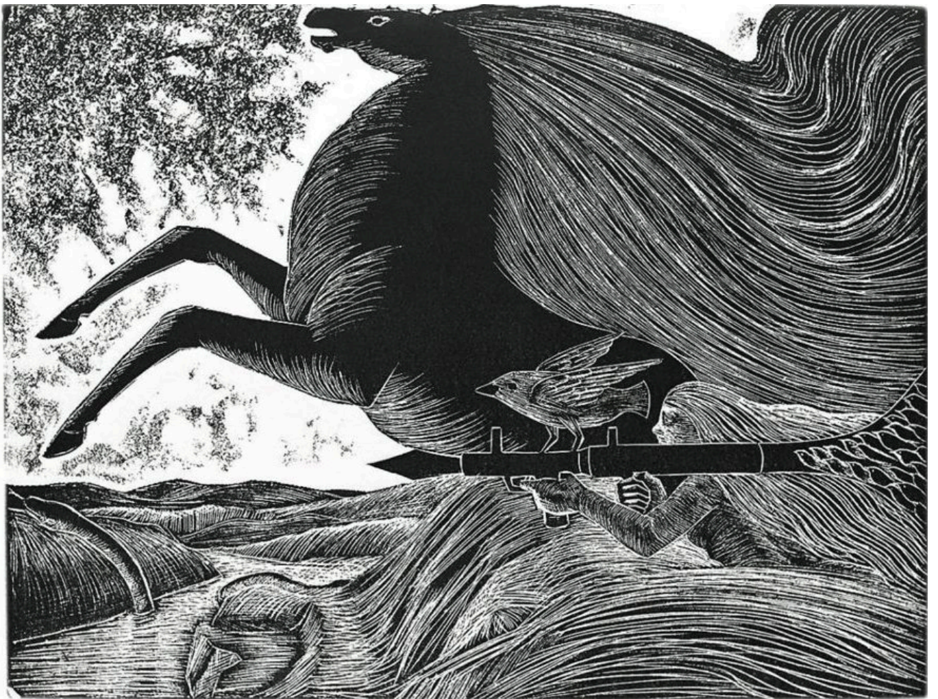
《卡拉梅战役》穆斯塔法·哈拉吉（巴勒斯坦）作于1969年

内塔尼亚胡的极限标准（即犹太人、不单是犹太复国主义国家对约旦河和地中海之间的土地拥有权利）并非突然出现在其政府声明之中。其根源在于以色列2018年的基本法（ Basic Law ），其中写道：“以色列国土是犹太人的历史家园，以色列国家在此建立。”这一法律手段将以色列确定为犹太人的国土，而不是一个多民族的领土。此外，“以色列国家”的各种行政定义都坚称对整个领土具有控制权。比如，以色列中央统计局（ Central Bureau of Statistics ）至少自1967年开始就错误地将居住在约旦河以西甚至西岸的以色列人列为以色列居民，以色列官方地图都没有体现1993年奥斯陆协议（ Oslo Accords ）所产生的内部划分。