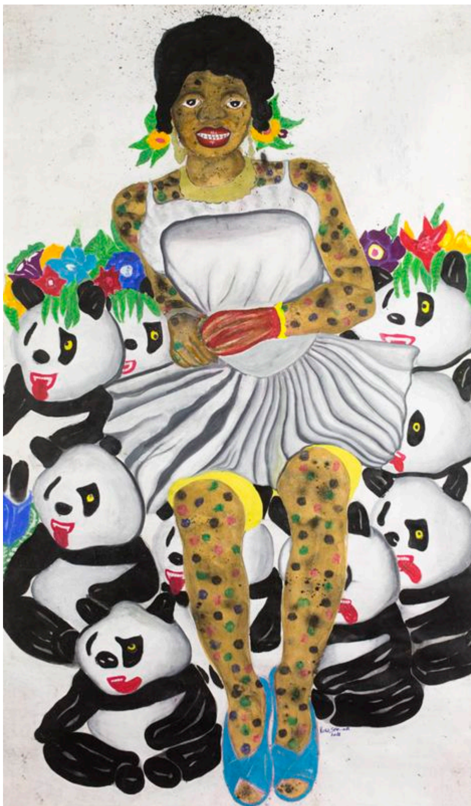
《熊猫小姐》库拉·肖马利（民主刚果）作于2018年

美国政府为诋毁中国在非声誉编织了一种话语体系，其核心是所谓“新殖民主义”，正如前国务卿希