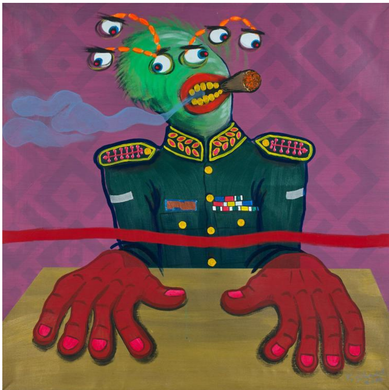
《无题》帕蒂·茨欣德勒（民主刚果）作于2016年