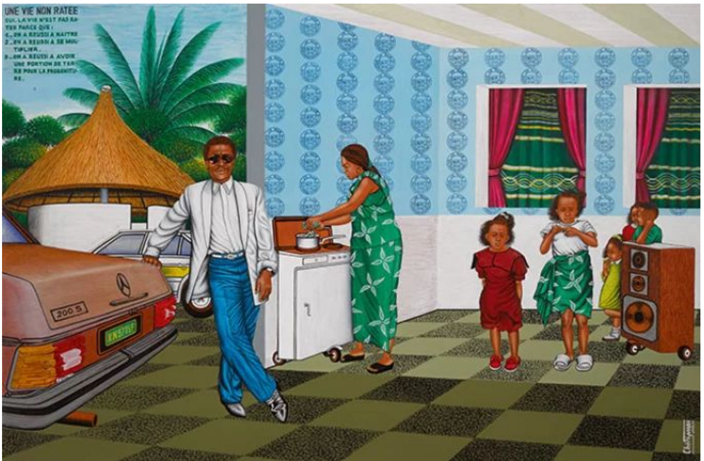
《成功人生》切里·桑巴（民主刚果）作于1995年

非洲国家负担的大部分债务都借自西方国家的 富有债权人 ，并由国际货币基金组织经手协调。这些坐拥 加纳、赞比亚 等国债务的私人债主们拒绝向正深陷困境的非洲国家提供任何债务减免。有关债务问题的对话往往忽视一个事实：这一长期债务困境的主要原因恰恰是非洲财富遭受了掠夺。