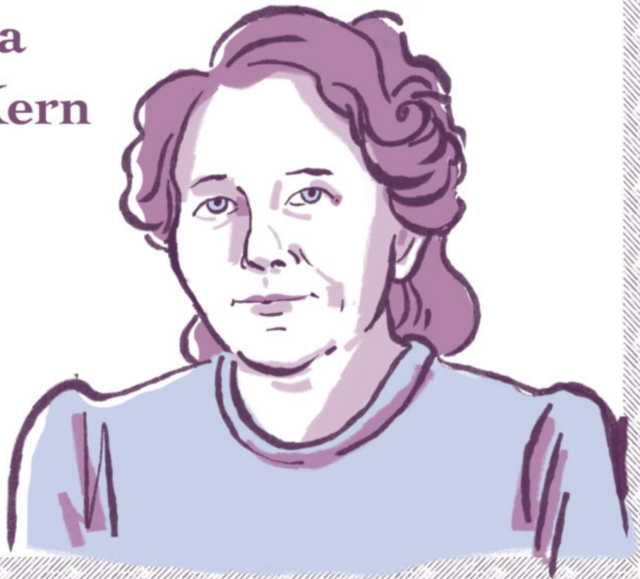
Katharina ‘Käthe’ Kern (1900–1985)

1945年，世界各地的共产主义妇女成立了国际民主妇女联合会（WIDF），该组织在设立国际妇女节上发挥了 重要作用 。1972年，WIDF澳大利亚分会的弗里达·布朗和澳大利亚共产党致函联合国， 建议 联合国举办国际妇女年，并推动《消除对妇女一切形式歧视公约》的实施。在WIDF的推动下，芬兰外交官、首位担任联合国助理秘书长的女性（当时97%的高级职位由男性担任）赫尔维·西皮拉支持国际妇女年的提议，该提议于1972年被接受，并于1975年举行了国际妇女年。1977年，联合国通过 决议 ，决定把每年的3月8日定为“妇女权利与国际和平日”，即现在的国际妇女节。