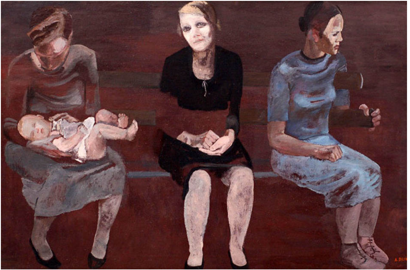
《失业在柏林》亚历山大·迪恩卡（苏联）作于1932年

上面所写的情况没有丝毫夸张。这些报告都来自世界卫生组织、世界银行等主流机构的研究者、分析者，而众所周知，这些机构是不会夸大资本主义政策的负面作用的。真要说的话，这些机构倒是倾向于极力淡化私有化、企业主导政策的危害，敦促进进一步削减公共系统开支。在格罗·哈莱姆·布伦特兰执掌世卫组织（1998-2003年）期间，世卫组织推动建立了公共私营合伙制（PPPs）、产品开发合伙制（PDPs）。世卫组织重视私营部门，国际货币基金组织也在施压削减公共部门资金，在不少贫穷国家导致公共卫生系统资源加速流失。