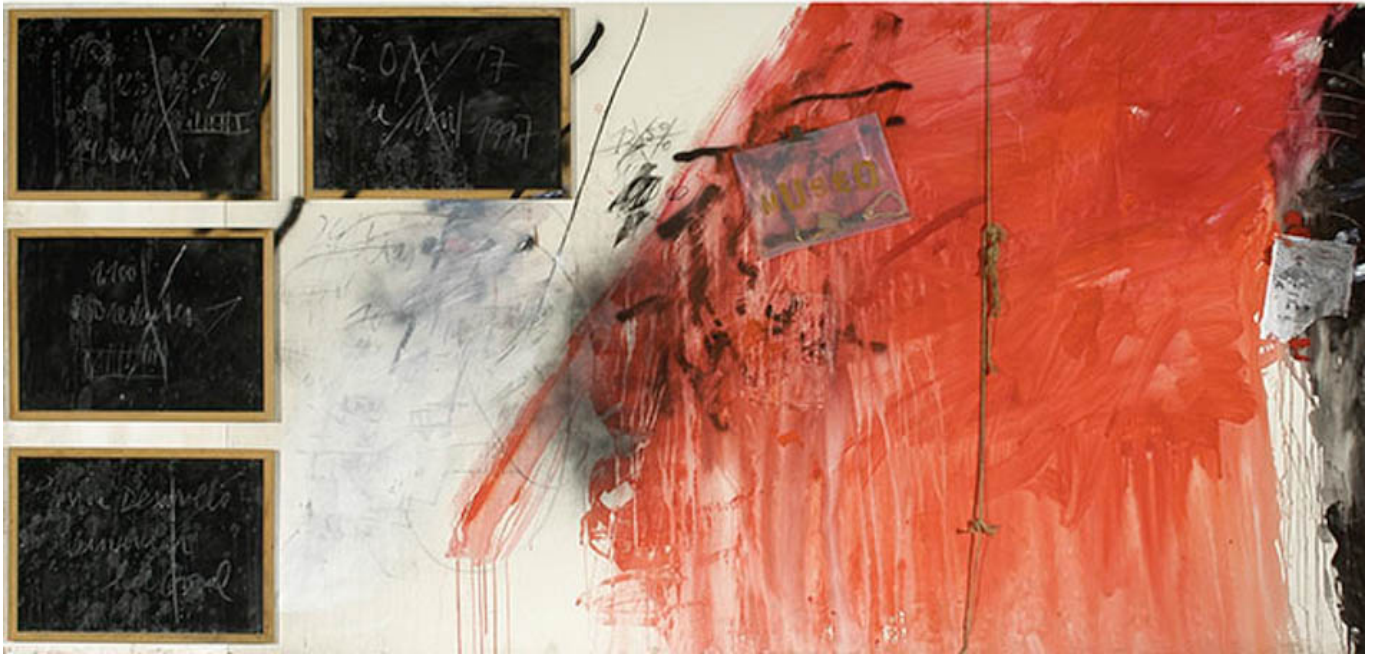
《沉默的洛塔》 何塞·巴尔梅斯（智利）作于2007年