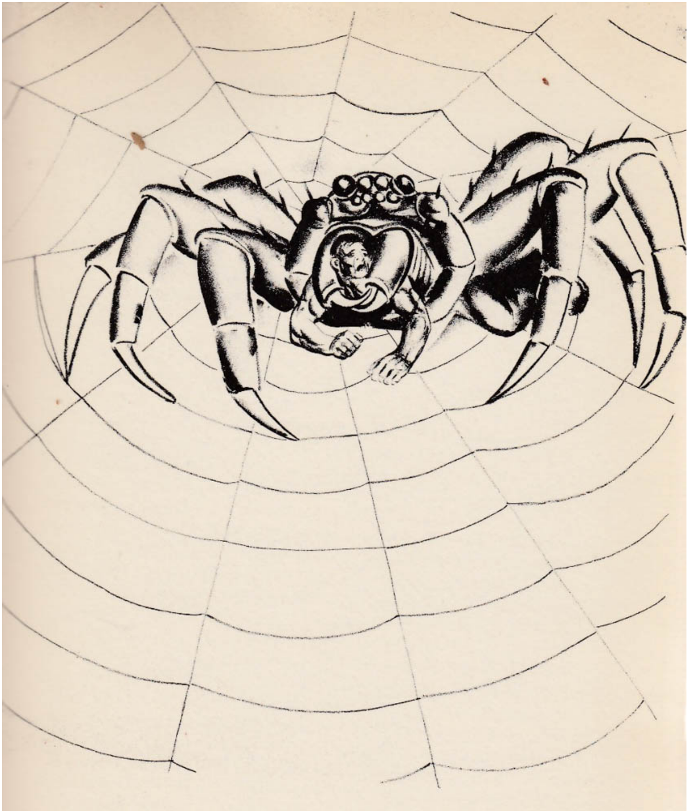
《格列佛同志》雨果·盖勒特（美国）作于1935年