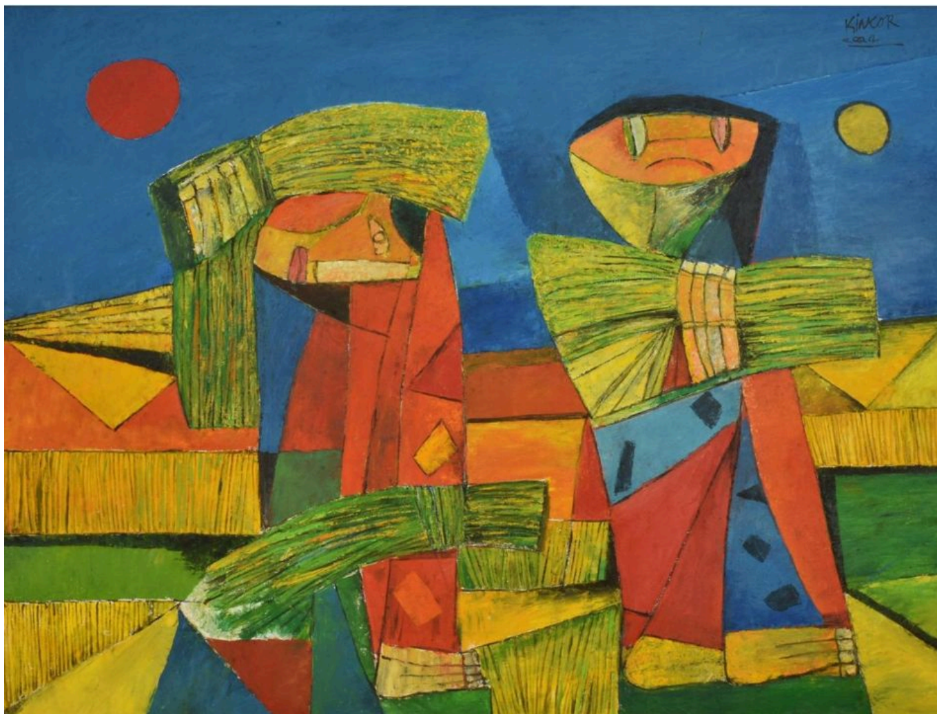
《丰收》洪救国（菲律宾）作于2004年