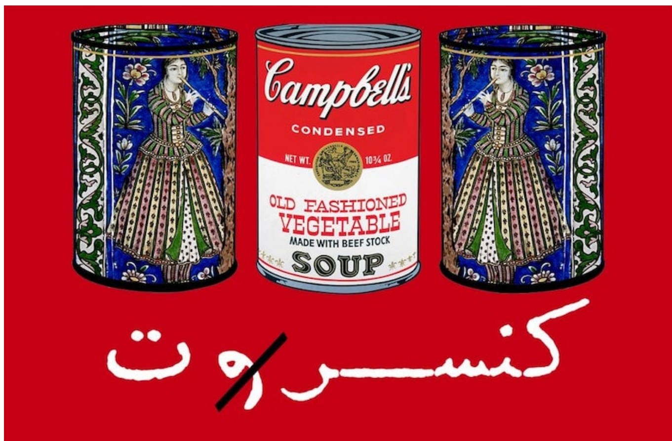
《音乐会》拉比·巴格沙尼（伊朗）作于2016年

这些倡议在国际人民大会的政治纲领中也有所体现，请关注他们在Facebook、Twitter、Instagram等社交媒体的账号，有关消除饥饿运动的详情将在以上平台发布。