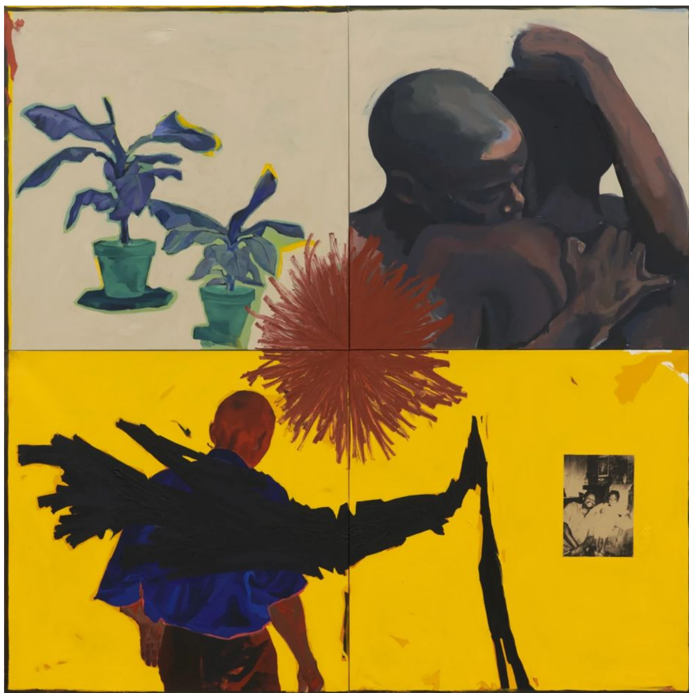
《有关亚当的一种说法》 库德萨内-维奥莱特·瓦米（津巴布韦）作于2020年

2020年8月第31期 汇编 《血腥政治：南非的政治压迫》（The Politic of Blood 3 : Political Repression in South Africa）列举了在南非司空见惯的政治暴力现象。下面节选了其中的两段：