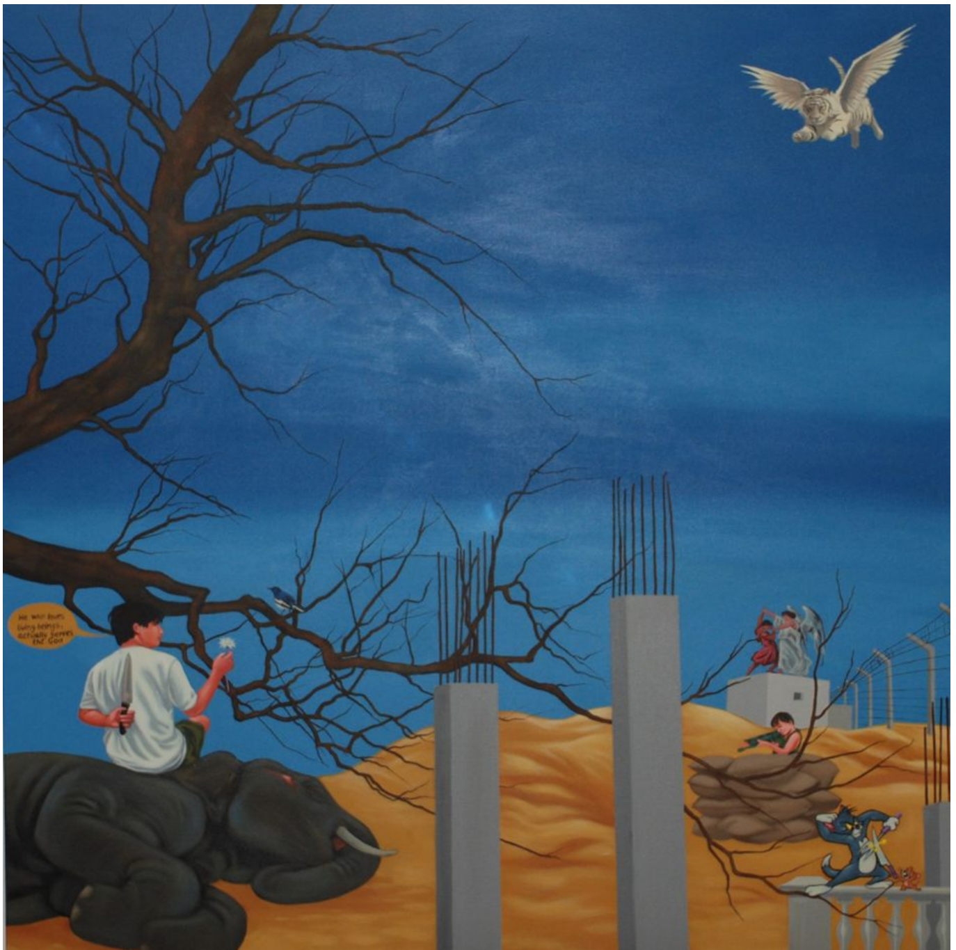
《曾经的丛林》 姆林默依·德巴马（印度特里普拉邦）作于2015年