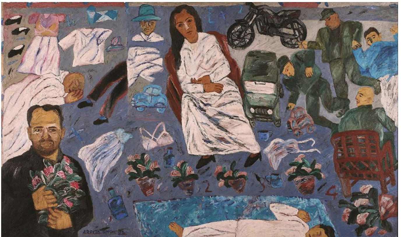
《你在此作甚？》 阿尔皮塔·辛格（印度）作于2000年

印共（马）及其媒体一直对人民党领导的全国政府持批判态度。印共（马）等组织上街抗议人民党的一系列政策，抗议活动得到了群众的热烈支持。印共（马）是左翼阵线的重要成员，左翼阵线在1978年到1988年、1993年到2018年执政。