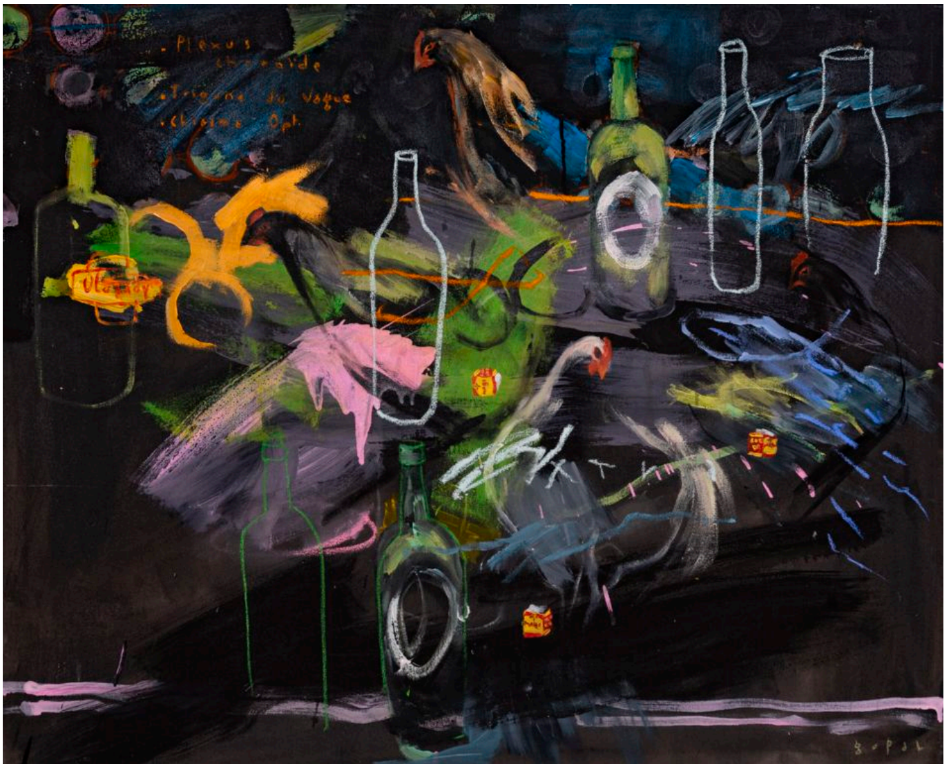
《与鸡共存》戈帕尔·达格诺戈（科特迪瓦）作于2019年

世界各地关切的人民和国际人民大会（International Peoples Assembly）等组织谴责针对印度左翼的袭击。