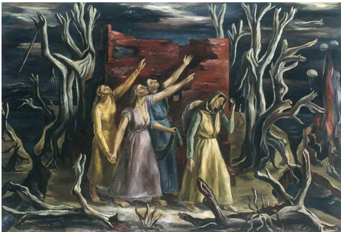
Raquel Forner (阿根廷), 《黑暗》, 1943