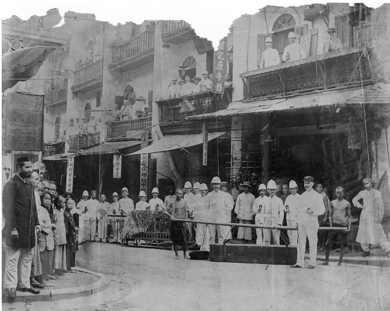
《瘟疫期间的斯塔福德军团》，香港，1894