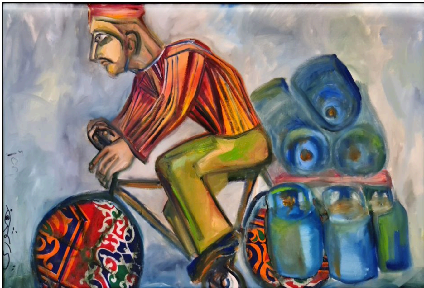
George Bahgoury (Egypt), Untitled , 2015.