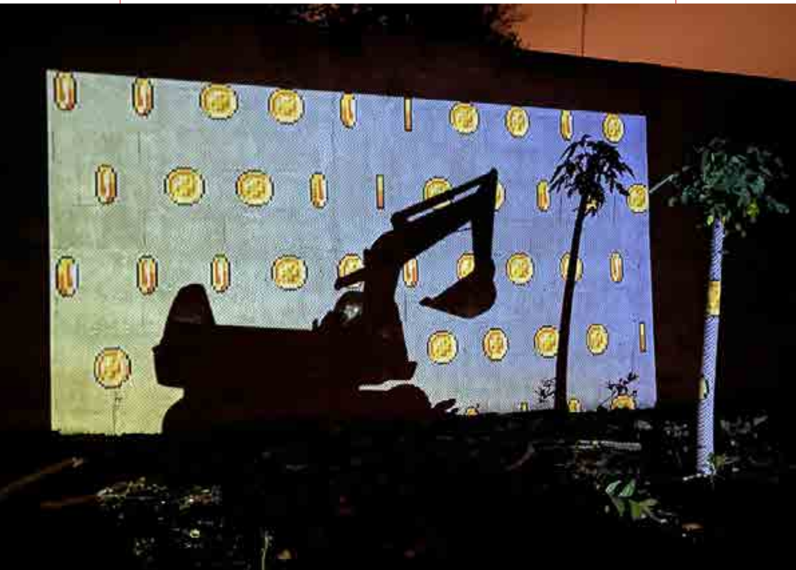
《加密货币挖矿》作于 2021 年