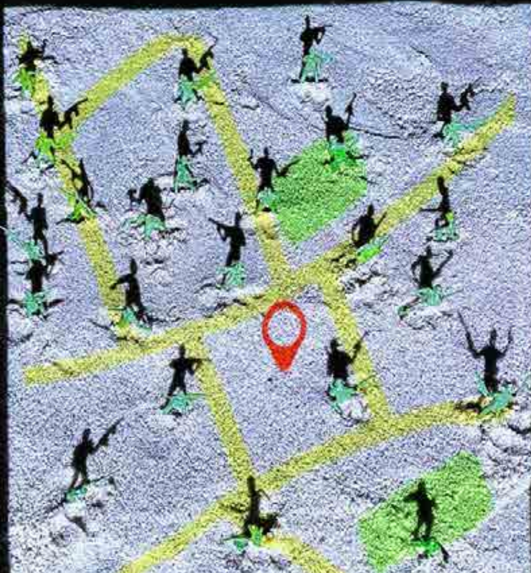
《全球定位系统的起源》作于 2021 年