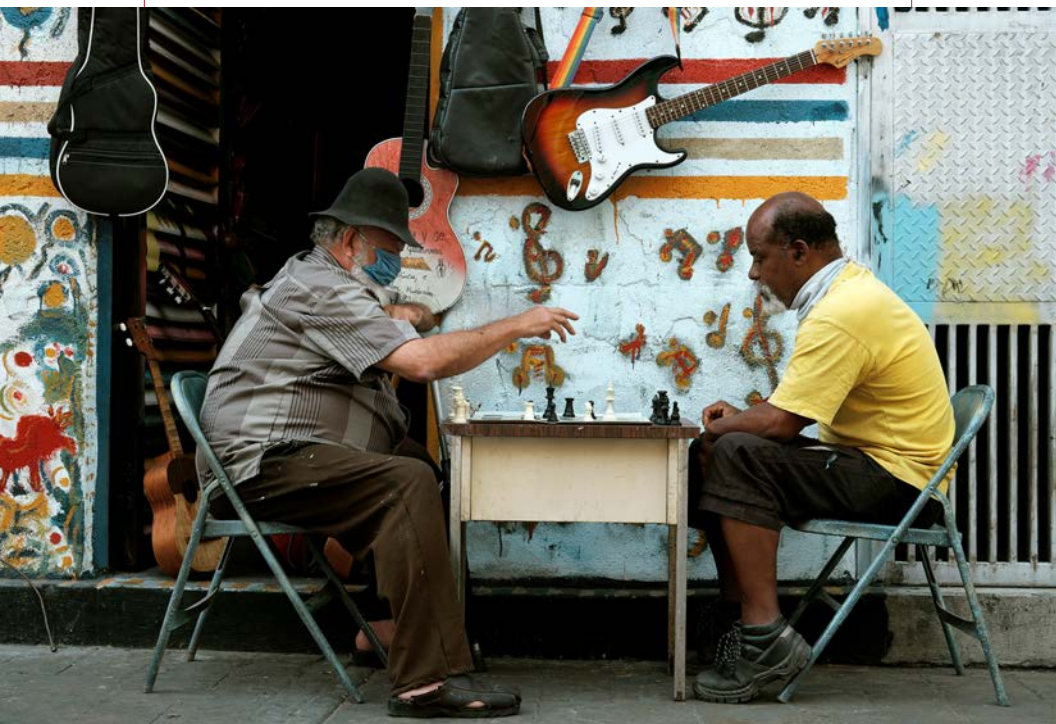
Xadrez em tempos de covid-19, Caracas, Venezuela, 2020.