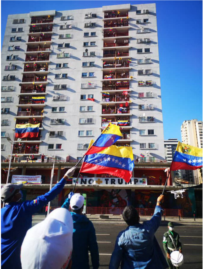
Manifestação em Caracas, Venezuela depois que o presidente Donald Trump pediu a prisão do presidente Nicolás Maduro, 28 de março de 2020.