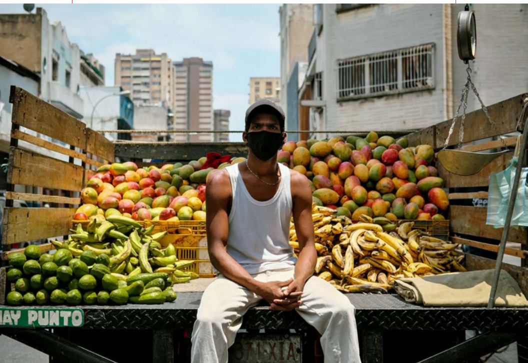
Mangas, bananas e abacate, Caracas, Venezuela, 2020.