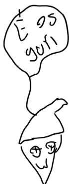
Ilustração feita por participante de uma oficina de mapeamento colaborativo

O Instituto Tricontinental de Pesquisa Social , em parceria com o Levante Popular da Juventude (LPJ) e o Movimento das Trabalhadoras e Trabalhadores por Direitos (MTD), produziu esta cartilha como resultado inicial da pesquisa sobre a Participação da juventude em periferias urbanas do Brasil . A motivação para a pesquisa é o diagnóstico da dificuldade de algumas organizações políticas ganharem os corações e as mentes da juventude nesses espaços, e a crescente percepção da participação desses sujeitos em grupos, espaços e movimentos organizados por igrejas neopentecostais.