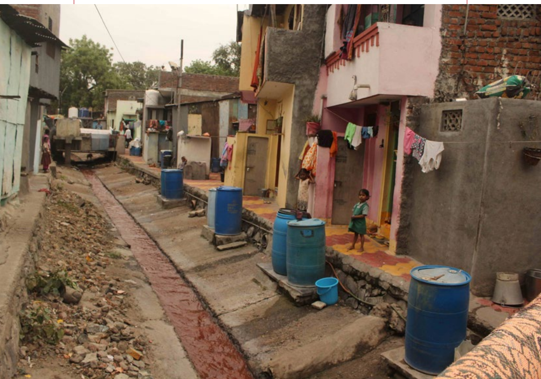
Favelas na cidade de Solapur