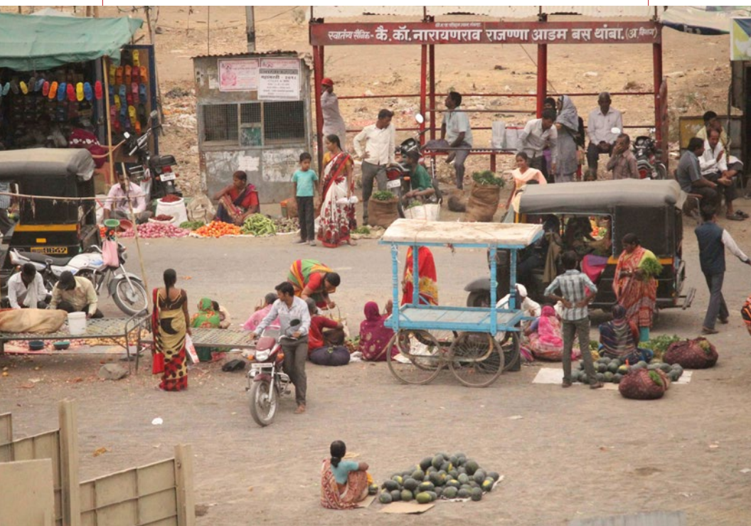
Mercado Noturno na Praça da Revolução, Kumbhari Subin Dennis/Instituto Tricontinental de Pesquisa Social