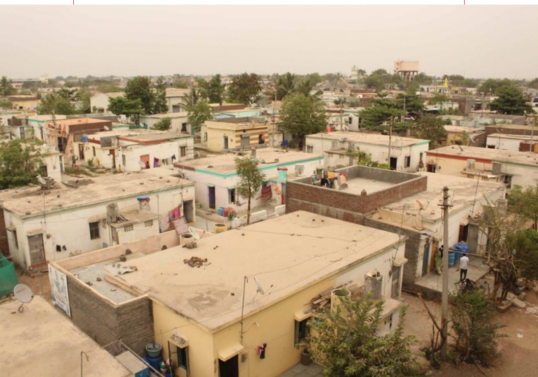
Conjunto Habitacional Godavari Parulekar