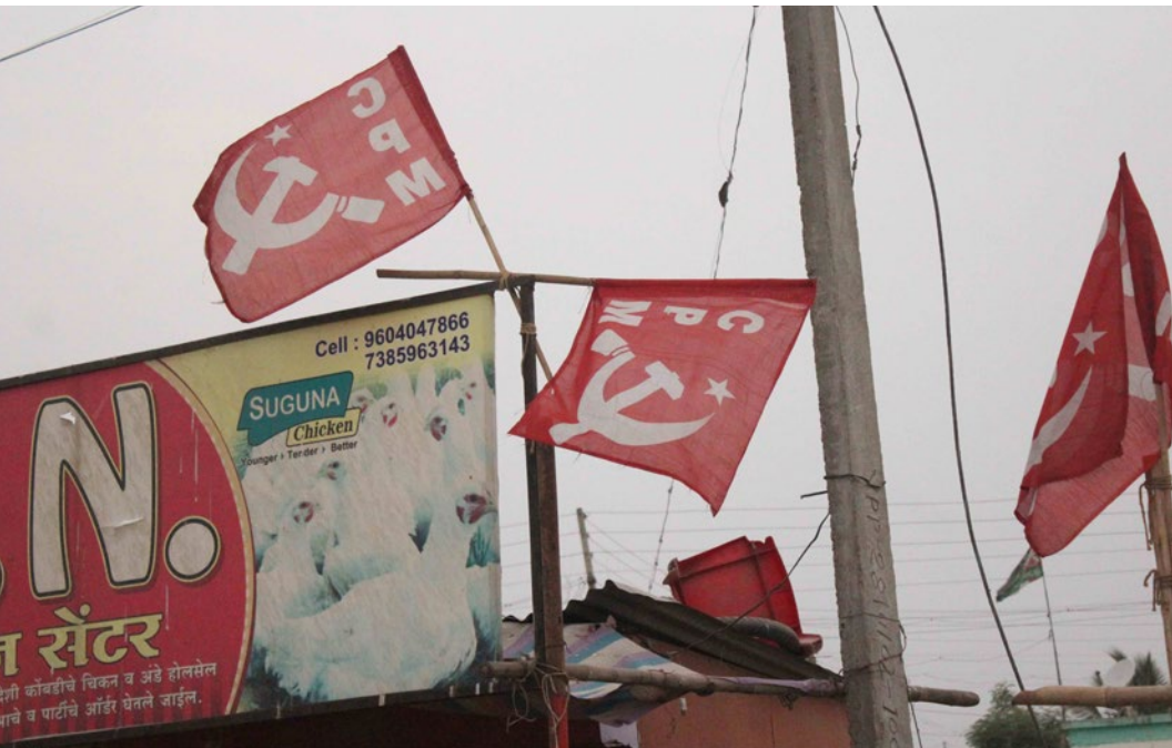
Bandeiras do Partido Comunista Indiano (Marxista) tremulando em cima de uma loja perto da Praça da Revolução, Kumbhari Subin Dennis/Instituto Tricontinental de Pesquisa Social

PCI (M) juntos entregaram ao Primeiro Ministro Atal Bihari Vajpayee em 8 de março de 2000, Dia da Mulher, a proposta. “Qual é o problema”, ele perguntou, e então lhe explicaram a reivindicação. “Venham para o meu escritório”, disse o primeiro-ministro. Lá, ele ligou para Jatiya e a orientou a sancionar o projeto das 10 mil casas”, recorda com carinho a importante vitória, quando grandes líderes vindos de vários partidos políticos deram as mãos para pressionar o governo central.