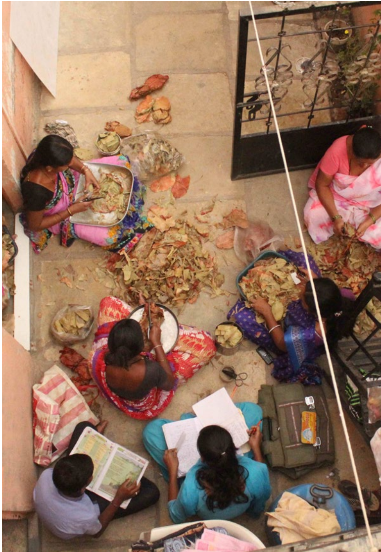
Mulheres rolando beedis no Kumbhari