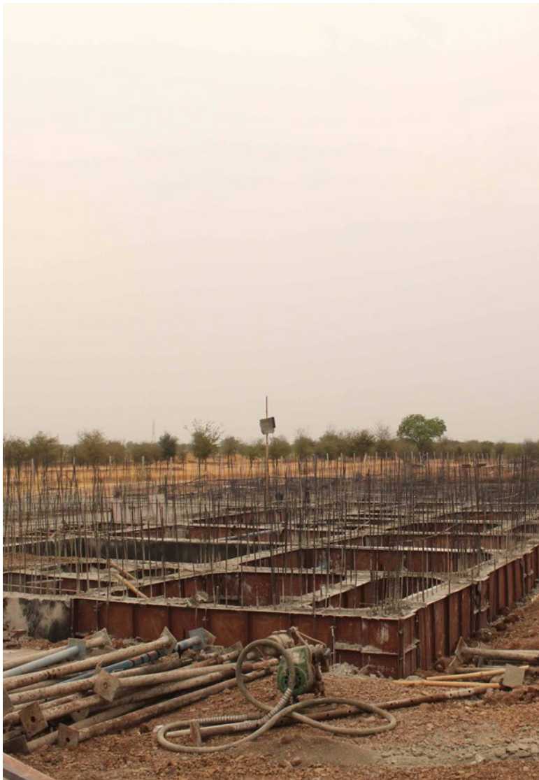
Conjunto Habitacional com 30 mil unidades, em construção