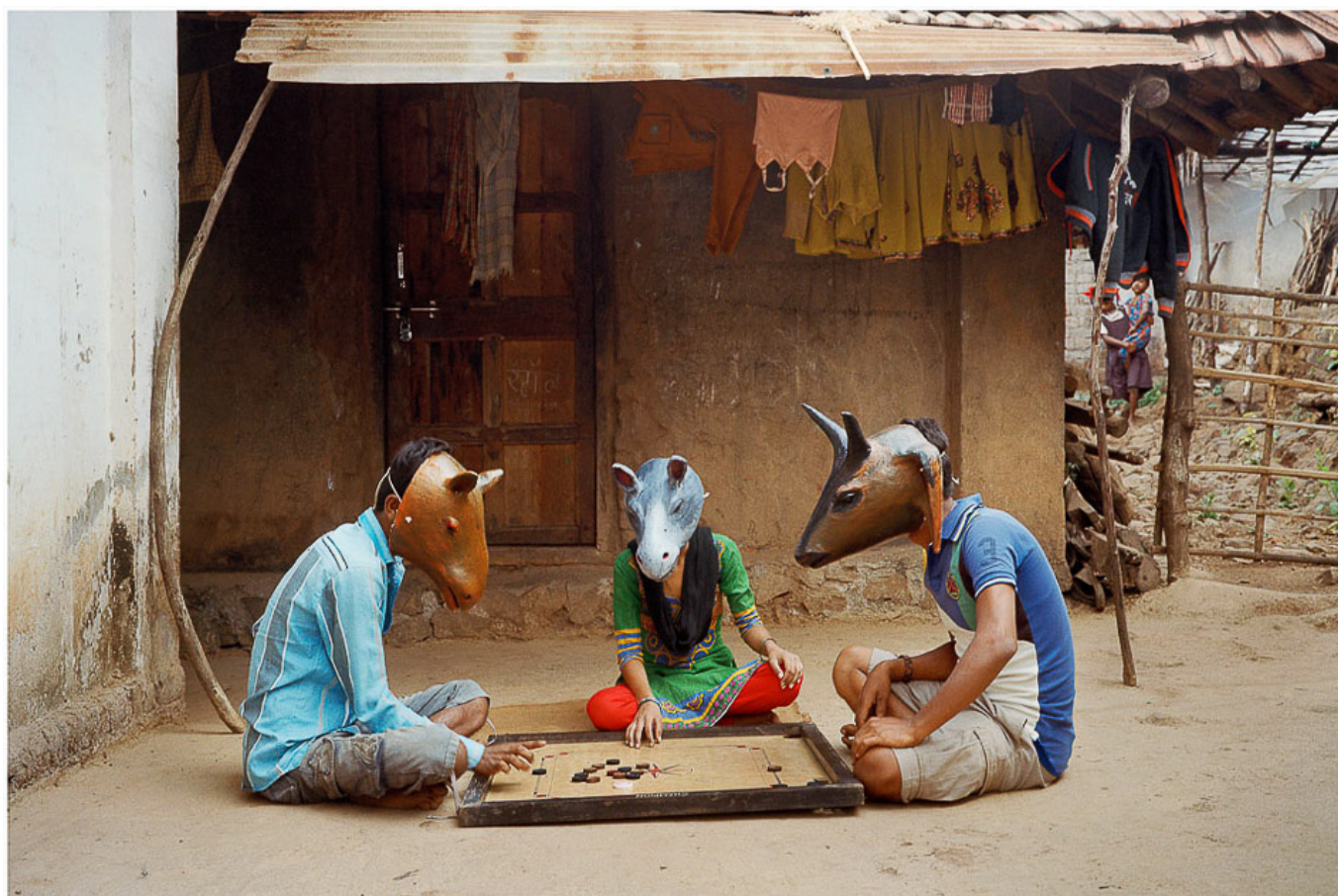
Gauri Gill, Гаури Гилл, Без названия (32) из серии «Игра видимости», 2015.