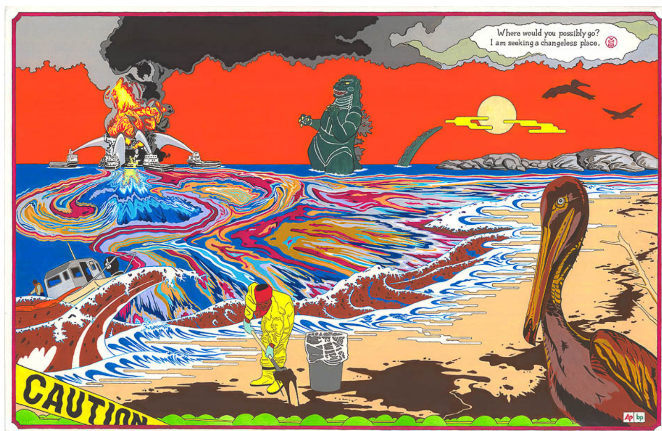
Джаве Есимото (Япония), Мимолетная встреча, 2010.

“экологический кризис” к “изменению климата” и предложить “зеленый капитализм” или, если быть более точным, “Новый зелёный курс” (Green New Deal) в качестве спасения от кризиса. Этот Новый зелёный курс — это просто использование государственных денег для обеспечения перехода частных энергетических компаний от углеродного к возобновляемому топливу, без заботы о шахтерах кобальта, лития и других полезных ископаемых, необходимых для батарей и экранов зеленых технологий. Необходимо продвигать дискуссию об экологическом кризисе, включив в нее более широкие вопросы аграрной реформы, передачи производственных активов в государственный сектор и углубить дискуссию об энергетическом переходе. Расчеты показывают, что капитализм требует примерно 3% роста для нормального функционирования, а это означает, что размер мировой экономики должен удваиваться каждые 25 лет. Планета не может выдержать такого экспоненциального роста.