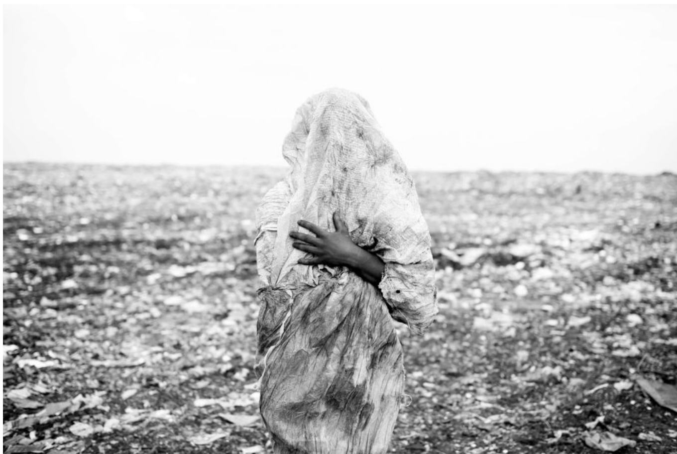
Mário Macilau (Moçambique), Dobrando a realidade: Sem título (2) , da série O canto do lucro , 2016.

Movimento Popular para a Libertação de Angola (MPLA) foram consideráveis, e o exército português perdeu mais soldados do que em qualquer outro momento desde o século 18. Várias dessas forças receberam ajuda da URSS e da Alemanha Oriental (RDA), mas foi por meio de sua própria força e iniciativa que acabaram vencendo as batalhas contra o colonialismo (como nossos colegas do Centro Internacional de Pesquisa sobre a RDA documentaram ).