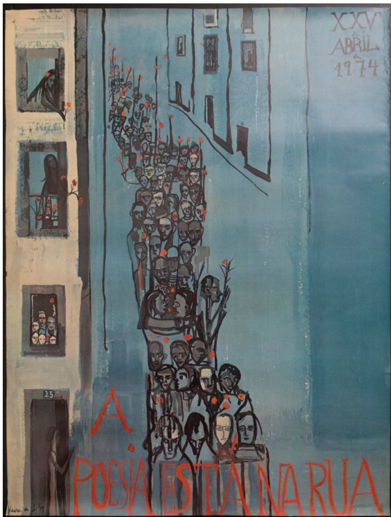
Maria Helena Vieira da Silva (Portugal), A Poesia Está Na Rua I , 1974.