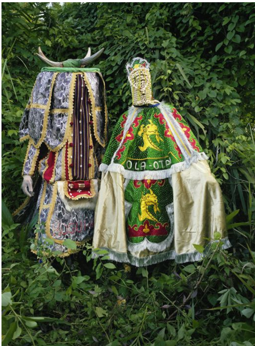
Leonce Raphael Agbodjélou (Benin), Egungun Masquerade XII , 2015.

No início de 2021, o presidente dos EUA, Joe Biden, afirmou que “a América está de volta, a aliança transatlântica está de volta”. Esse pronunciamento veio dois anos depois que Macron disse que a Organização do Tratado do Atlântico Norte (Otan), eixo dessa aliança, estava sofrendo de “morte cerebral”. A resposta de Macron à declaração de Biden sobre o retorno dos Estados Unidos foi simples: “por quanto tempo?”. A visita de Macron a Washington semana passada tem revelado a tensão entre a exigência dos Estados Unidos de subordinação europeia e a necessidade de independência da Europa em relação aos requisitos de segurança