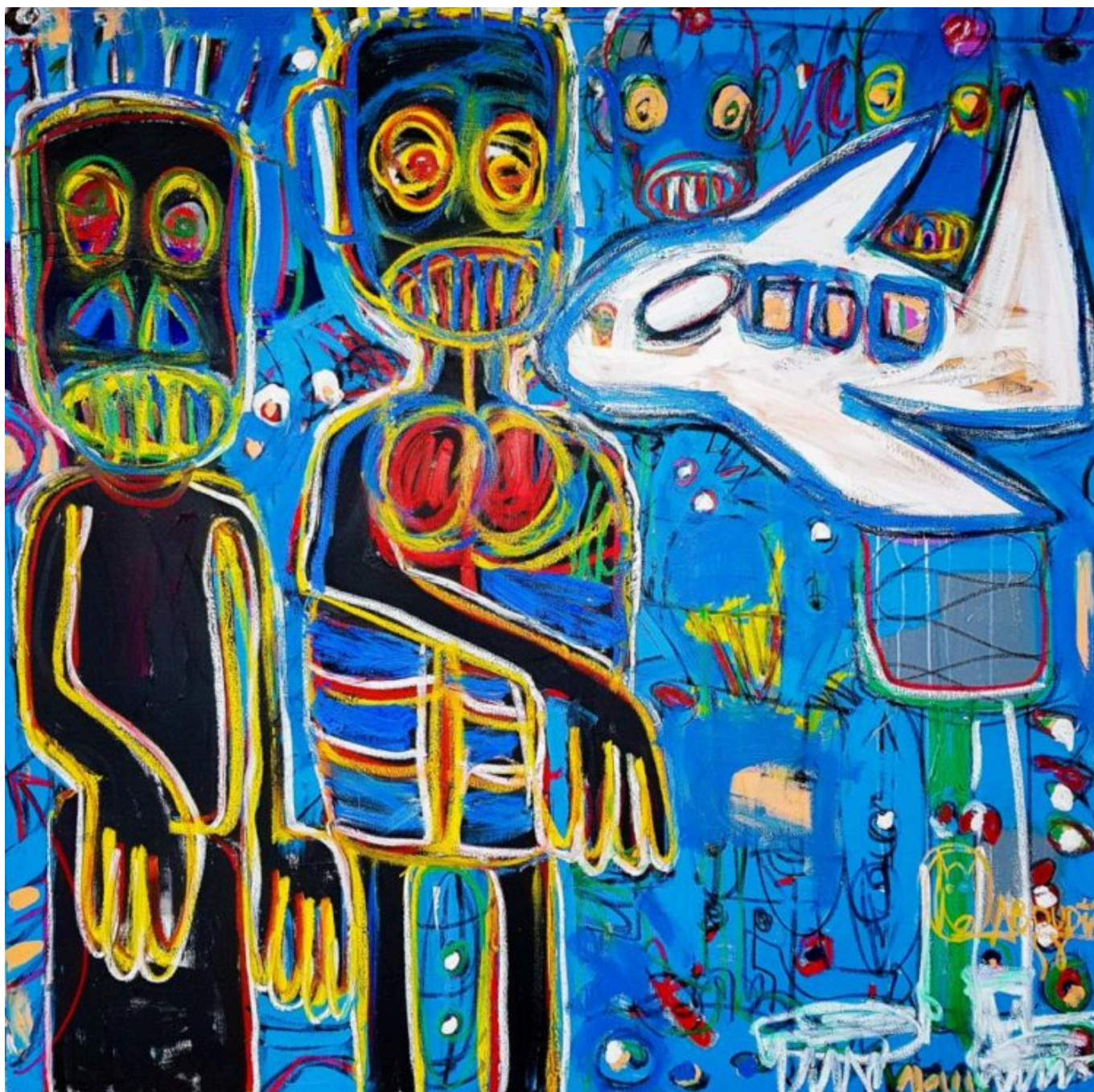
Aboudia (Costa do Marfim), O aventureiro II , 2018.

As forças armadas francesas continuam a ter uma forte presença no norte da África: retiram-se apenas parcialmente da região do Sahel e mantêm laços militares e diplomáticos estreitos em países como o Níger. Jean-Luc Mélenchon, o líder do partido socialista democrático La France Insoumise, me disse no ano passado que “não há urânio na França, nós importamos principalmente do Níger e do Cazaquistão”. Uma em cada três lâmpadas na França é iluminada por urânio do Níger, e é por isso que as tropas francesas guarnecem a cidade de Arlit, rica em urânio. A retirada francesa indica o fim de suas intervenções militares neocoloniais e estruturas de acumulação na região? A realidade é muito mais complexa. Essas retiradas parciais estão