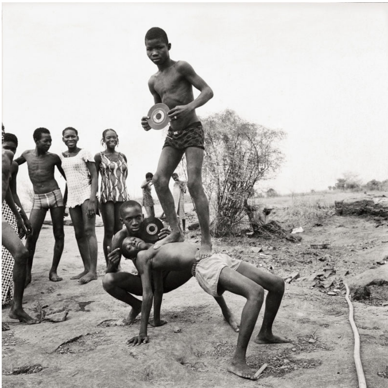
Malick Sidibé (Mali), Pique nique na estrada , 1972.

Essa não é a primeira vez que o Mali se afasta da França para desenvolver um projeto nacional independente. Em 1960, o Mali conquistou sua independência e o presidente Modibo Keita liderou o país em sua busca por estabelecer a soberania e contribuir para o desenvolvimento de uma política pan-africanista para o continente. Em 1968, o general Moussa Traoré deixou o quartel e derrubou o governo socialista de Keita. A derrubada de Keita não foi singular; o golpe no Mali fez parte de uma série de golpes militares no continente, do Burundi