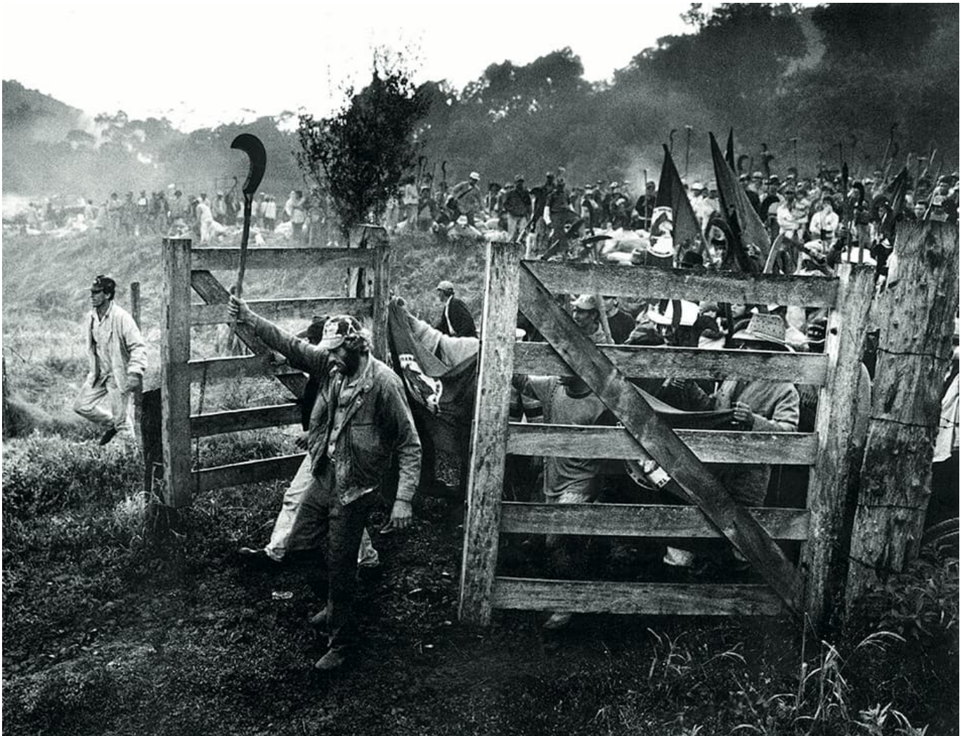
सेबास्टियो सालगादो, भूमि के लिए संघर्ष: मानव टुकड़ी का मार्च, 1997

ये ऐसा एजेंडा है जो आगे देखता है और मानवीय चिंता को घृणा के साथ घोलता नहीं हैं।