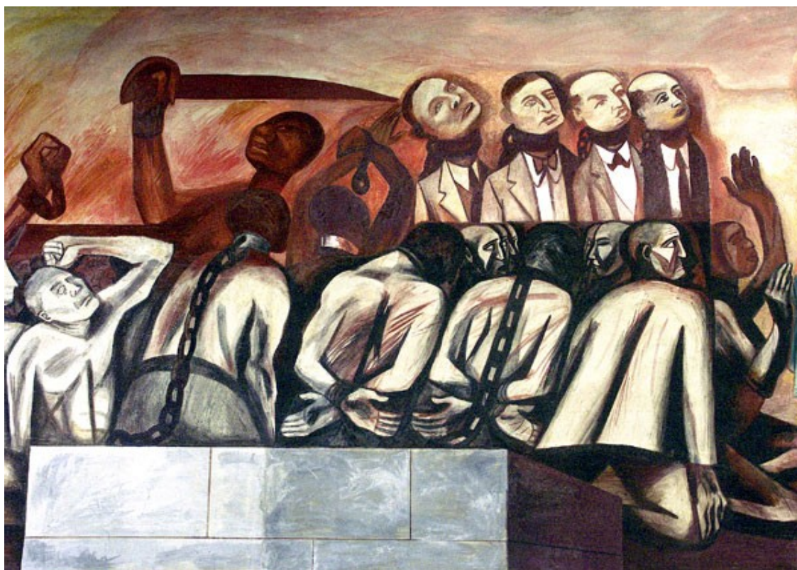
José Clemente Orozco. Lutte en Orient : Esclavage, impérialisme et Gandhi , 1930.