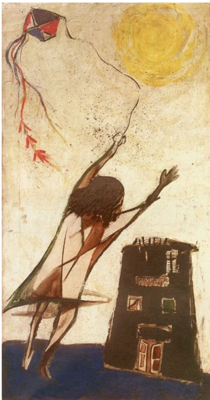
Gazbia Sirry, Le cerf-volant , 1960.

Condamner l'empire soulèverait aussi des questions sur l'Inde d'aujourd'hui. Entre 1900 et 1946, alors que l'économie britannique se développait, le revenu par habitant en Inde stagnait. La Grande-Bretagne a pris les gains de l'Indien ordinaire et les a utilisés pour se développer économique et pour mener ses guerres. C'est ce vol des ressources indiennes qui a conduit à la famine du Bengale de 1943, où au moins trois millions de personnes sont mortes. La Grande-Bretagne a détourné de la nourriture de l'Inde et n'a fourni que peu ou pas de secours aux populations du Bengale côtier en cas de famine. L'empire britannique a commencé par une famine (1769-1770) et se termine par une famine (1943). Il définit, pour nous, l'empire lui-même.