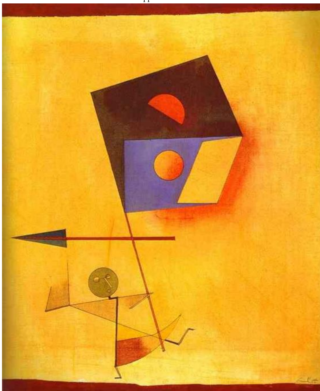
Paul Klee, Conquistador , 1930.

Lorsque le président mexicain Andrés Manuel Lopez Obrador a tenté de soulever la question de la colonisation espagnole des Amériques, il a été repoussé par le gouvernement espagnol et par le Vatican. Aucune des puissances européennes ne souhaite être honnête sur son histoire de vol et de brutalité. Ce n'est pas à leur ordre du jour. Ils aimeraient oublier. Nous aimerions leur rappeler et s'adresser directement à eux.