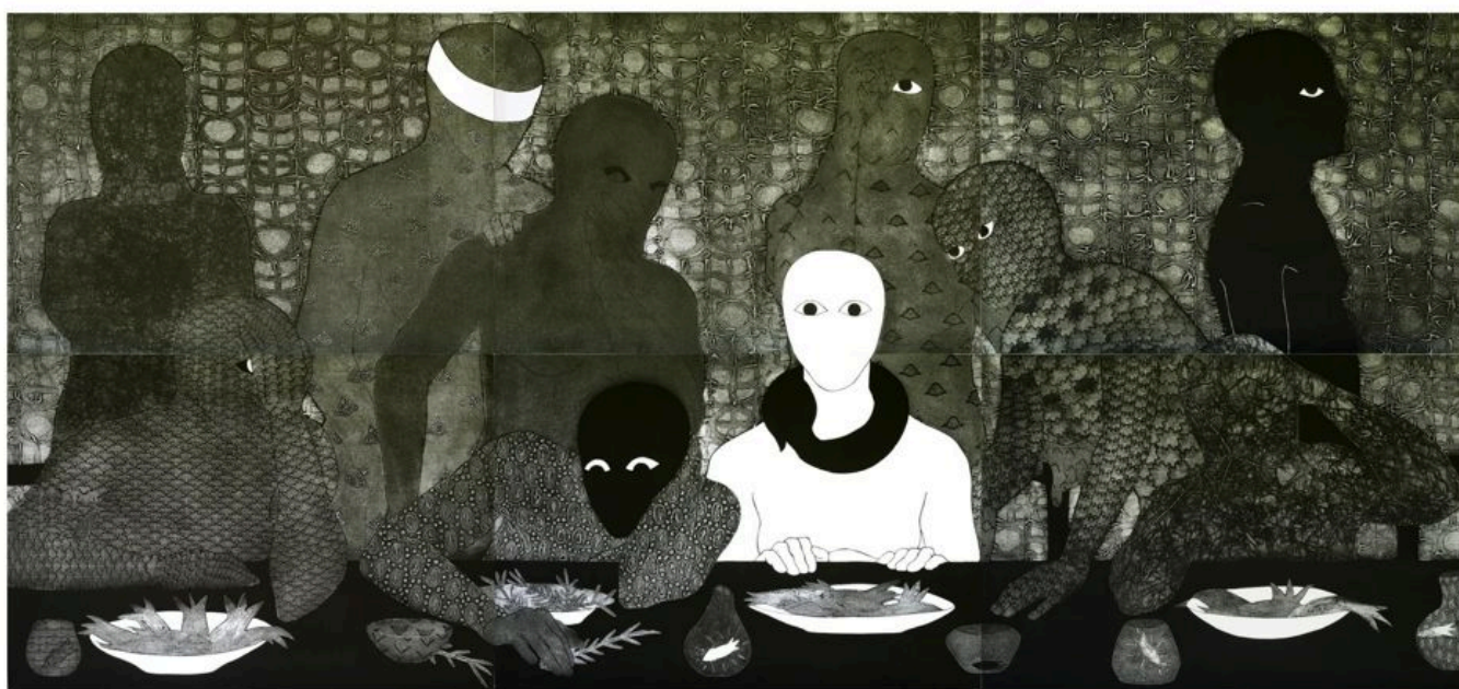
Belkis Ayón (Cuba), La cena , 1991.

Ucrania. Un nuevo proyecto de ley de gastos suplementarios que asciende a 105.000 millones de dólares (además del presupuesto militar de 858.000 millones de dólares para 2023, probablemente infravalorado ) incluye 61.400 millones de dólares para la guerra devastadora en Ucrania y 14.100 millones de dólares para el genocidio israelí del pueblo palestino. Aunque se iniciaron conversaciones de paz entre las autoridades ucranianas y rusas, tanto en Bielorrusia como en Turquía, días después de la entrada de las tropas rusas en Ucrania, la OTAN las frustró precipitadamente, lo que avivó el conflicto que, hasta la fecha, ha causado la muerte de casi 10.000 civiles. La cifra de civiles muertos en Ucrania durante un año y ocho meses de conflicto ya ha sido superada por la de civiles muertos en Palestina en apenas cuatro semanas.