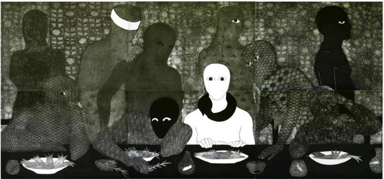
Belkis Ayón (Cuba), La cena , 1991.

Ucrania. Un nuevo proyecto de ley de gastos suplementarios que asciende a 105.000 millones de dólares (además del presupuesto militar de 858.000 millones de dólares para 2023, probablemente infravalorado ) incluye 61.400 millones de dólares para la guerra devastadora en Ucrania y 14.100 millones de dólares para el genocidio israelí del pueblo palestino. Aunque se iniciaron conversaciones de paz entre las autoridades ucranianas y rusas, tanto en Bielorrusia como en Turquía, días después de la entrada de las tropas rusas en Ucrania, la OTAN las frustró precipitadamente, lo que avivó el conflicto que, hasta la fecha, ha causado la muerte de casi 10.000 civiles. La cifra de civiles muertos en Ucrania durante un año y ocho meses de conflicto ya ha sido superada por la de civiles muertos en Palestina en apenas cuatro semanas.