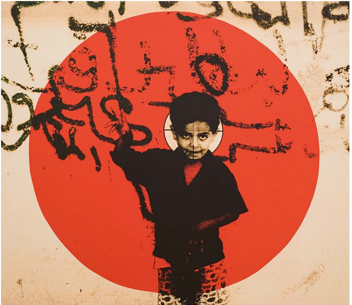
Laila Shawa (Palestina), Target 2009 [Objetivo 2009], 2009.

Incluso cuando altos funcionarios estadounidenses hablan de una “pausa humanitaria”, siguen destinando miles de millones de dólares y más sistemas de armamento al ejército israelí. Esta idea de una “pausa humanitaria” es jerga legal que no significa nada para la supervivencia de las y los gazatíes: la pausa pondría fin a los bombardeos durante un breve periodo de tiempo, posiblemente solo unas horas, para permitir que se retire a los heridos y que entre algo de ayuda en la ciudad de Gaza antes de dar luz verde a los israelíes para reanudar su bombardeo asesino. Hasta ahora, Israel ha lanzado sobre Gaza un tonelaje de explosivos superior al peso combinado de las dos bombas lanzadas sobre Hiroshima y Nagasaki en 1945.