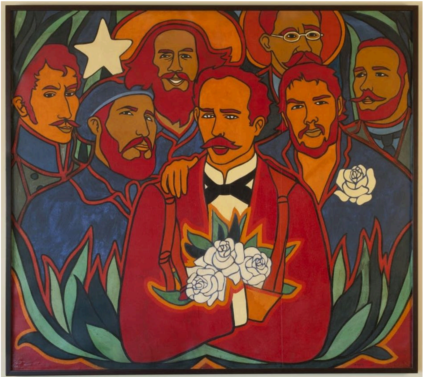
Raúl Martínez (Cuba), Rosas y Estrellas , 1972.

Aunque el bloqueo ha costado a la Revolución Cubana cientos de miles de millones de dólares desde 1960, no ha podido impedir que la revolución construya la dignidad de las personas. Por ejemplo, el Banco Mundial informó de que en 2020, a pesar del duro bloqueo y de la pandemia de COVID-19, el gobierno de Cuba gastó el 11,5% de su Producto Interno Bruto en educación, mientras que Estados Unidos gastó el 5,4%. No solo todas las escuelas son gratuitas para las y los niños cubanos, sino que todos reciben comidas en la escuela y se les entregan sus uniformes. La educación médica también es gratuita en Cuba, lo que crea una elevada proporción médico-paciente de 8,4 médicos y 7,1 enfermeros por cada 1.000 habitantes. En la Asamblea General de la ONU, el ministro de Asuntos Exteriores de Cuba, Bruno Rodríguez Parrilla, señaló que “la atención al ser humano ha sido y seguirá siendo la prioridad del gobierno cubano”. El bloqueo puede ser una “guerra económica”, dijo, pero la Revolución Cubana, que se ha enfrentado a este “asedio económico” durante décadas, no flaqueará. Se mantendrá firme.