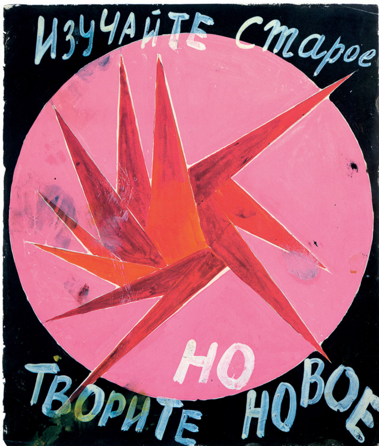
Varvara Stepanova (URSS), Study the Old, but Create the New [Estudiar lo viejo, pero crear lo nuevo], 1919.

No hay nada especialmente radical en el proyecto de Recoleta, admite Jadue. Anteriormente, las personas empobrecidas iban a la municipalidad a cobrar los apoyos monetarios para comprar medicamentos, por ejemplo, y luego usaban ese dinero para comprar en el extremadamente caro sector privado. Ahora, en vez de