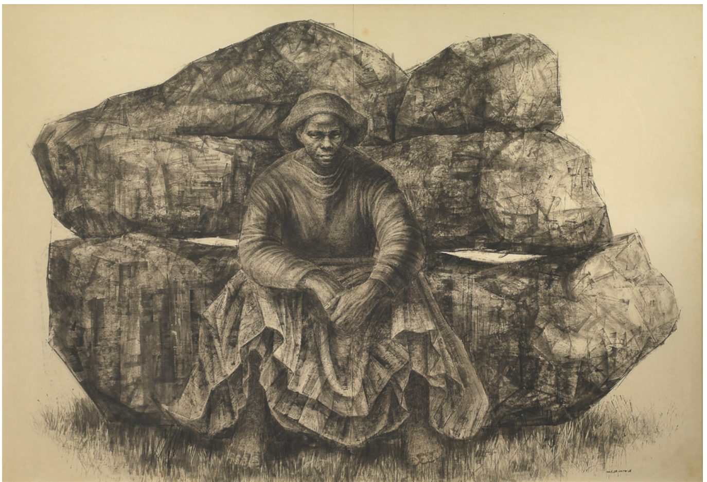
Charles White (EE. UU.), General Moses (Harriet Tubman) , 1965.

Si esta política sensata no solo ofrece ayuda a lxs pobres sino que también ahorra dinero a la municipalidad, ¿por qué otras municipalidades no siguen el modelo de Recoleta?, le pregunto. “Porque no están interesadas en el bienestar de la gente”, me responde Jadue. “El capitalismo crea a la persona pobre”, dice, y luego los pobres vienen a pedir bienes y servicios al Estado debido a su relativa impotencia. “Los pobres son más honestos que los ricos. Si pueden comprar bienes y servicios a un precio justo, entonces no piden dinero”.