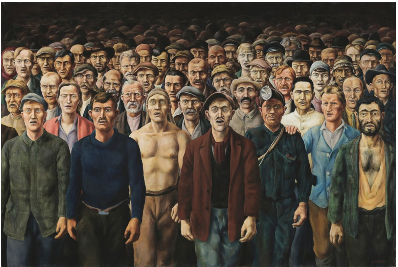
Otto Griebel (Germany), The Internationale , 1929/30.