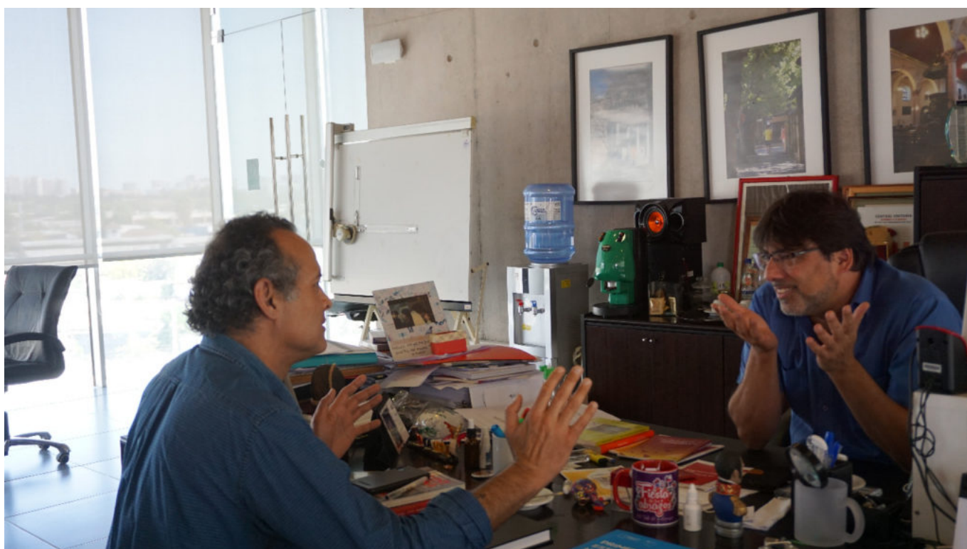
Daniel Jadue habla con Vijay Prashad